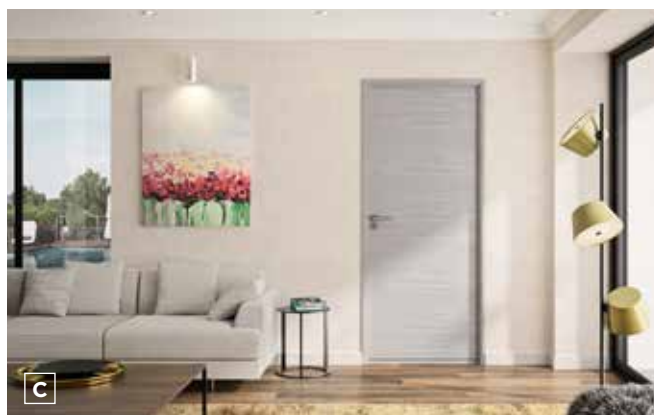
A/ Bloc porte Milano (chêne foncé) - B/ Bloc porte Vérone (chêne taupe). C/ Bloc porte Bilbao (chêne gris clair).