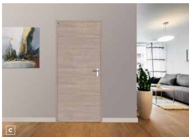
A/ Renove Porte Atelier - B/ Renove Porte Bilbao (chêne gris clair) C/ Renove Porte Vérone (chêne taupe) - D/ Renove Porte revêtu blanc.