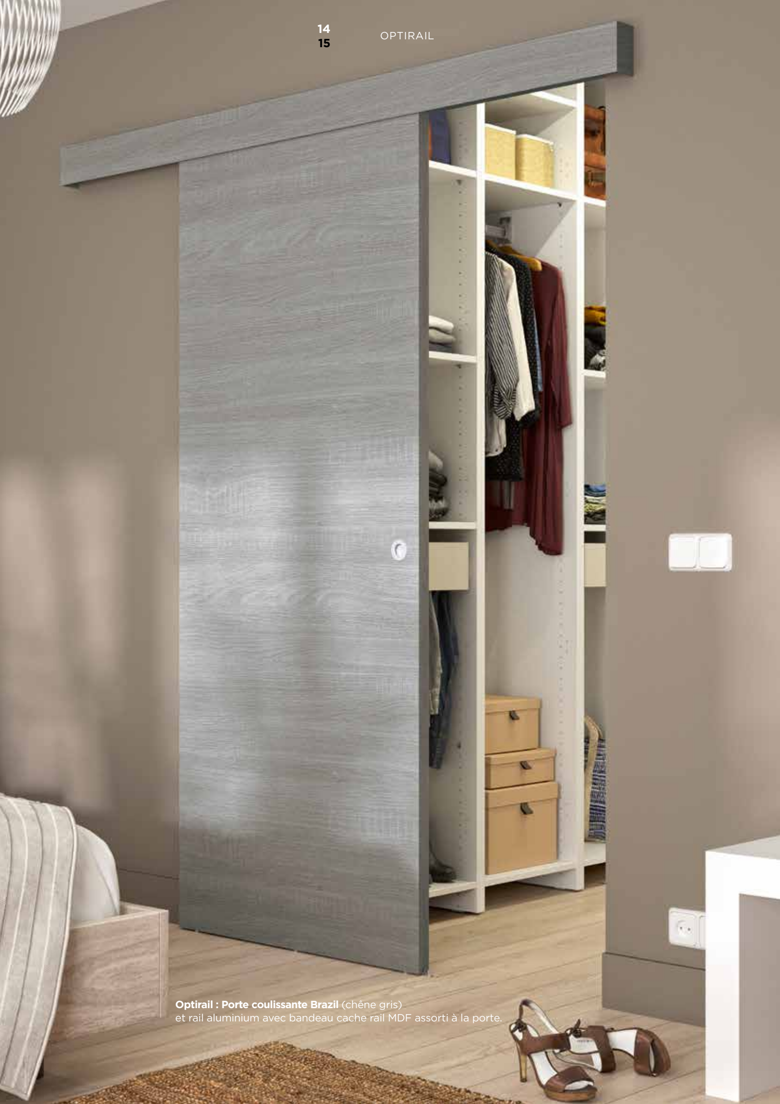
Optirail : Porte coulissante Brazil (chêne gris) et rail aluminium avec bandeau cache rail MDF assorti à la porte.