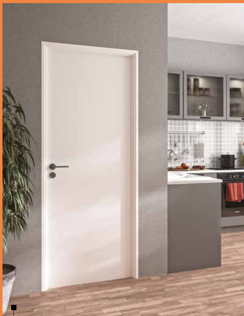
Bloc porte (revêtu blanc).

— Une réponse globale et innovante pour équiper en portes intérieures l'ensemble de la maison.