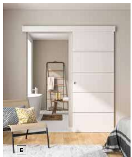
A/ Rail + Bandeau MDF et porte coulissante (blanc prêt-à-peindre) - B/ Rail + Bandeau MDF et porte coulissante Bilbao (chêne gris clair) C/ Rail + Bandeau MDF et porte coulissante vitrée Vérone (chêne taupe) - D/ Rail + Bandeau MDF et porte coulissante Barbade (chêne sauvage naturel) - E/ Rail + Bandeau MDF et porte coulissante (blanche lignée revêtu).